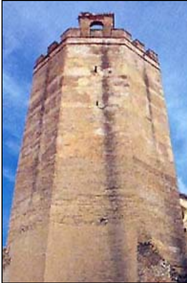
Torre de Espantaperros, Badajoz.

Península Ibérica, donde podemos encontrarlas en Sevilla, Badajoz o Calatayud, constituyendo un elemento identificador de la época árabe y, concretamente, del dominio Almohade (S.XII).