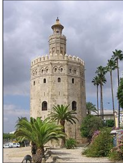
Torre del Oro, Sevilla