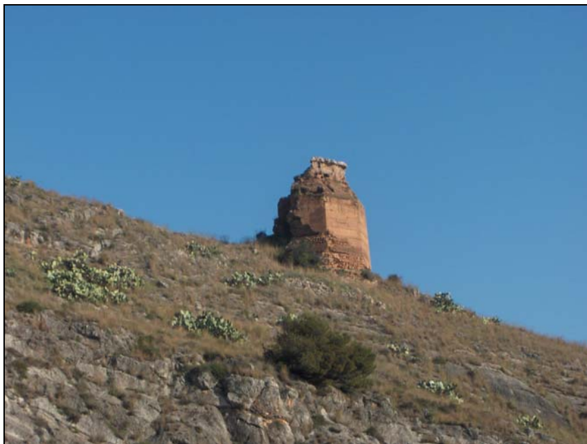
Panorámica de la Torre Octogonal

La Torre Octogonal, así llamada por poseer una planta en octógono, se encontraba en un estado de conservación muy frágil. El hecho de estar construida con un tapial de tierra apisonada por tongadas y recubierto por el denominado “calicostrado”, la hace muy vulnerable a los agentes climáticos sobre todo cuando la tierra queda expuesta a la intemperie por la pérdida de la costra de cal que la protege. A su vez, esta costra de cal se suele desprender de la pared del muro por falta de mantenimiento y las filtraciones producidas por el agua de lluvia a través de las grietas que se producen con el paso del tiempo.