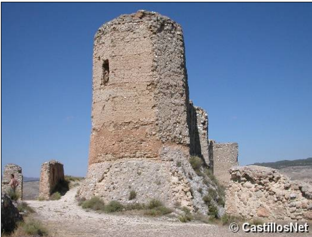
Torre del Castillo de Ayub, Calatayud